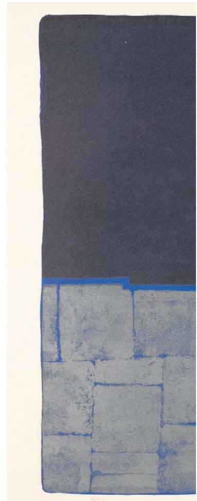
ENKELT SYMBOLSPRÅK: Å se bildene som