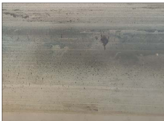
MATERIALBASERT: Gunnhilde Høyer overbeviser med sine konseptuelt gjennomarbeidede verker.